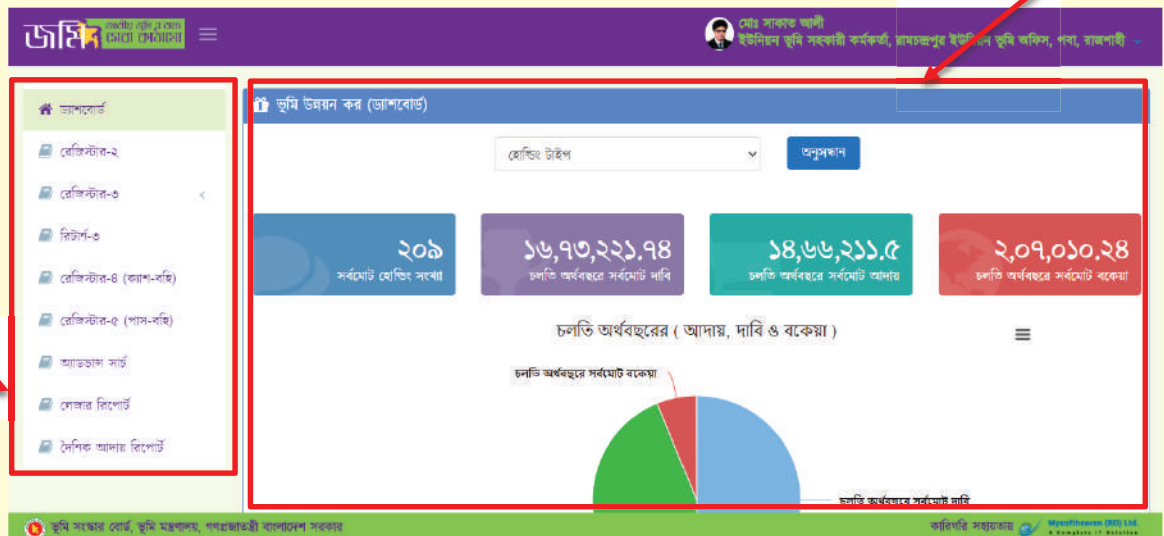
চিত্র-৩: ভূমি উন্নয়ন কর ড্যাশবোর্ড

ন্যাভিগেশন মেনুঃ বাম পাশের মেনু থেকে ক্লিক করে অন্যান্য লিংকে যেতে পারবেন।