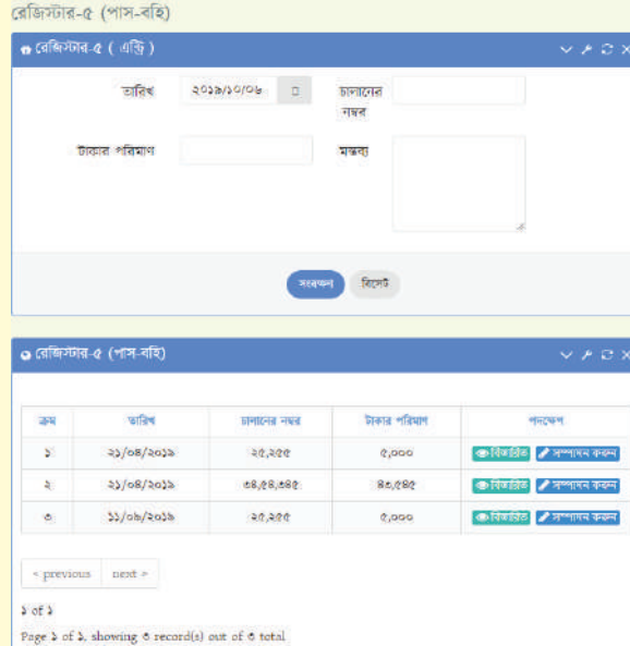
চিত্র-১২: স্বয়ংক্রিয় রেজিস্টার-৫ (পাস-বহি)

রেজিস্টার-৫ (পাস-বহি) স্বয়ংক্রিয়ভাবে তৈরি হবে। রেজিস্টার-৫ (পাস-বহি) এন্ট্রি করার জন্য তারিখ, চালান নং, টাকার পরিমাণ ও মন্তব্য দিয়ে সংরক্ষণ করতে হবে। নিম্নের চিত্র-১২ এর ন্যায় প্রদর্শিত হবে।